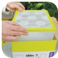
Αφαιρέστε το πλαστικό κουτί της κυψέλης

ΠΡΟΣΟΧΗ: κατά το άνοιγμα του δοχείου γλυκόζης Biogluc® βεβαιωθείτε πως δεν θα σπρώξετε προς τα μέσα το φυτίλι. Είναι απαραίτητο να εξασφαλιστεί η κατάλληλη τροφοδοσία γλυκόζης.