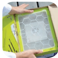
Πιέστε ελαφρά το πλαστικό κουτί της κυψέλης στην σωστή θέση