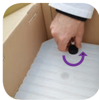
Ανοίξτε το δοχείο Biogluc®