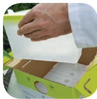
Τοποθετήστε πίσω το πλαστικό κουτί της κυψέλης